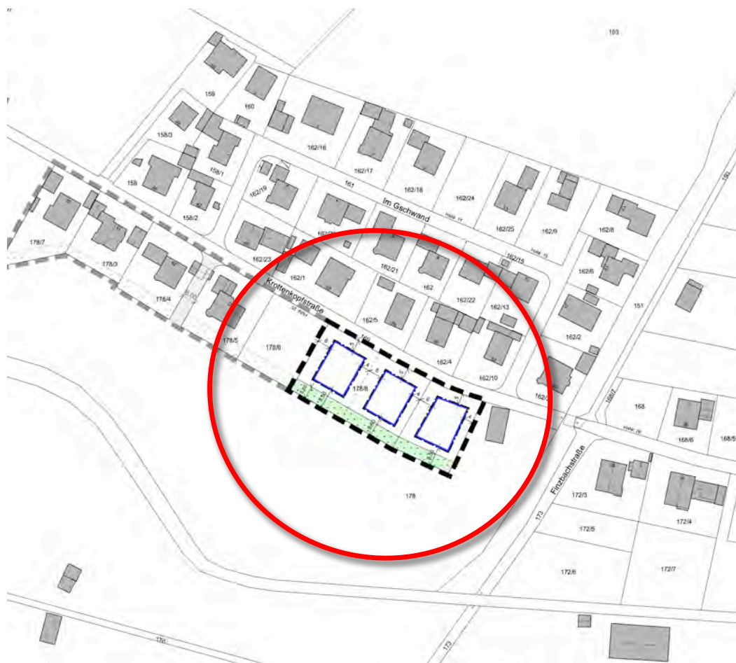
Lageplan mit dem Geltungsbereich des Bebauungsplans, o.M.

Im Geltungsbereich des Bebauungsplanes befinden sich die Grundstücke mit der Fl.Nr. 178/8 und 178 (Teilfläche), die direkt an der Krottenkopfstraße anliegen.