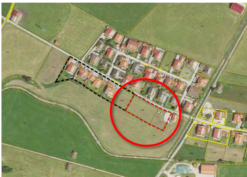
Luftbild o.M. mit dem Bereich der Satzung (schwarz) sowie des Bebauungsplans (rot)

Der Ortsteil an der oberen Krottenkopfstraße liegt im Westen des Ortes Krün etwas abgesetzt vom Hauptort inmitten landwirtschaftlich genutzter Flächen und wird über die Krottenkopf- wie über die Finzbachstraße erschlossen. Der Ortsteil liegt auf ca. 880,00 m ü. NN, Luftlinie ca. 500 m westlich des Ortszentrums.