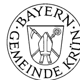
Thomas Schwarzenberger Erster Bürgermeister