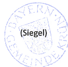
Thomas Schwarzenberger Erster Bürgermeister