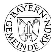
Thomas Albrecht Erster Bürgermeister