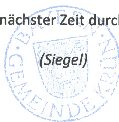
Thomas Schwarzenberger Erster Bürgermeister