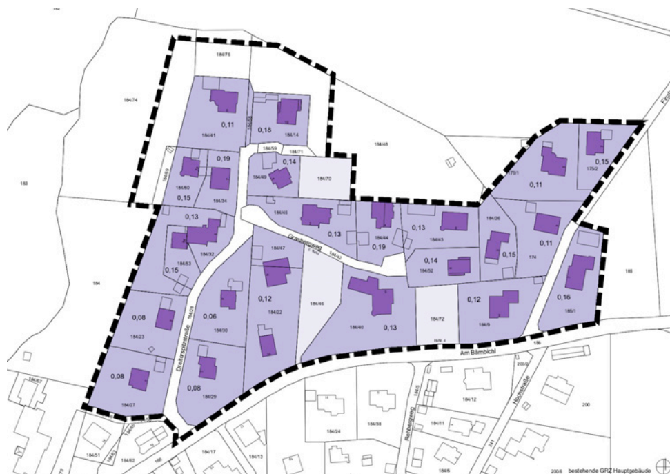
Bestehende Grundflächenzahlen der Hauptgebäude im Geltungsbereich, o-M-

Die bestehenden Grundflächenzahlen (GRZ) der Hauptgebäude wurden wie oben dargestellt ermittelt. Hellviolette dargestellt sind die drei unbebauten Grundstücke. Die Grundstücke sind locker bebaut, die GRZ liegt zwischen 0,08 und 0,19.