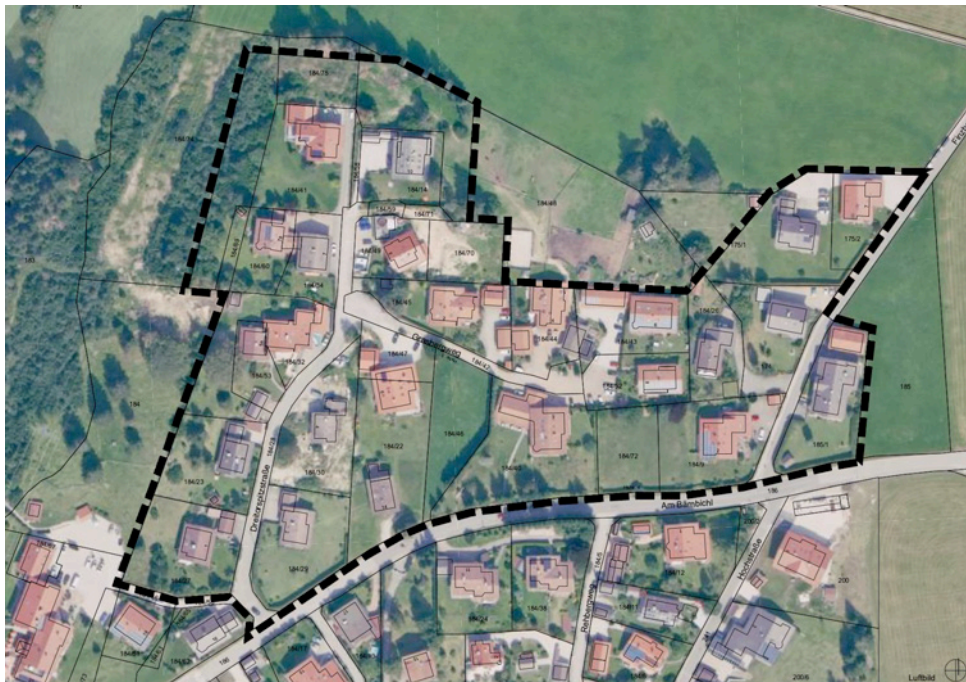
Luftbild mit dem Geltungsbereich des Bebauungsplanes Bärnbichl-Nord, o-M-

Für Teilbereiche des Planungsgebietes „Bärnbichl-Nord“ in der Gemeinde Krün wurden im Jahr 1963 ein Bebauungsplan aufgestellt sowie in den Jahren 1994, 1996 und 2005 Innenbereichssatzungen. Um die städtebauliche Entwicklung zu lenken und eine geregelte Nachverdichtung zu ermöglichen, beschloss der Gemeinderat für die Geltungsbereiche der bestehenden Satzungen den Bebauungsplan B-038 „Bärnbichl-Nord“ im beschleunigten Verfahren gem. § 13 a BauGB aufzustellen.