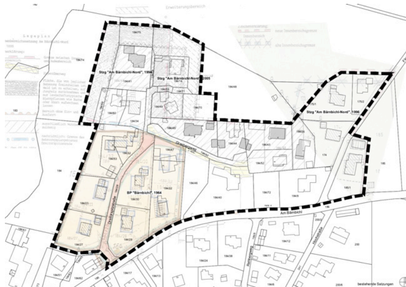
bestehende Satzungen im Geltungsbereich, o-M-

In den verbindlichen Satzungen wurde die Grenze zwischen Innen- und Außenbereich festgesetzt sowie Flächen, die von jeglicher Bebauung frei zu halten sind.