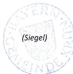
Thomas Schwarzenberger Erster Bürgermeister